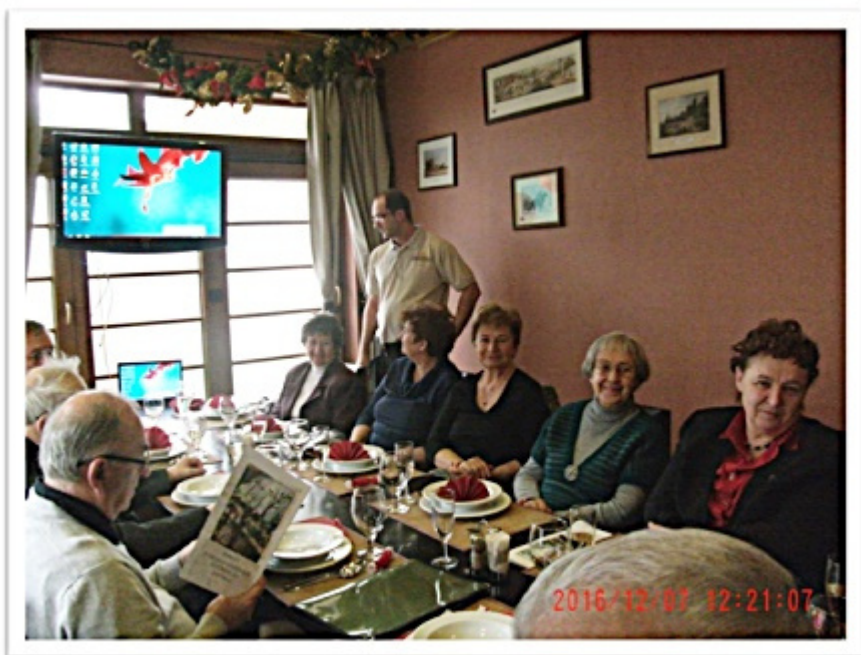
Pálma Étterem 2016.