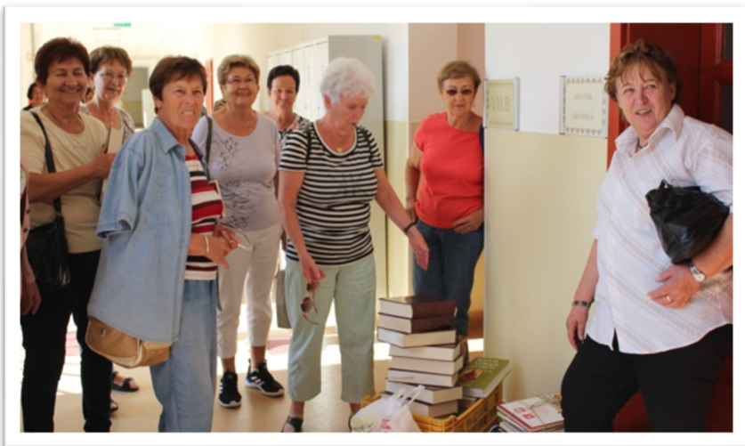
Könyvajándékunk a szamosújvári iskolának. 2018.

jártunk. Meghallgatva az akár több évszázados történelmüket, megható volt küzdelmüket látni a magyar nyelvű oktatásért.