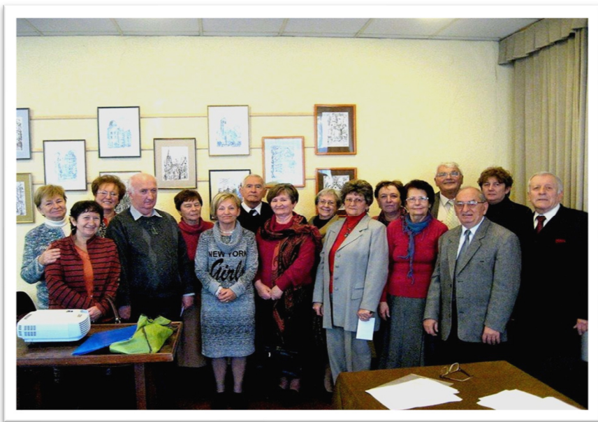
A kibővített elnökség. Debrecen, 2015.