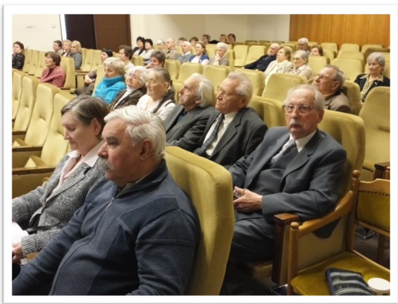
DAB székház 2018.