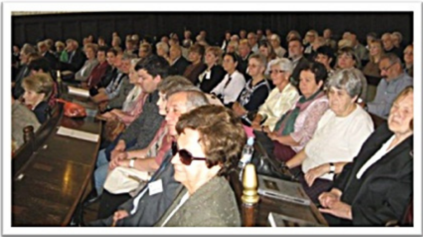
Debrecen Megyei Ház 2017.