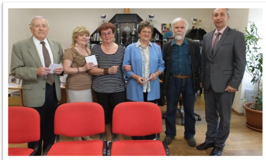
Fülek (Szlovákia), 2017.

Hagyománnyá vált a kapcsolatteremtést célzó közös utazás, így már hazai, felvidéki, erdélyi és délvidéki iskolákkal ismerkedhettek meg az egyesületi tagok. Több erdélyi, felvidéki iskolához könyvadományokat juttatott el a tagság, segítve a magyar tannyelvű oktatást.