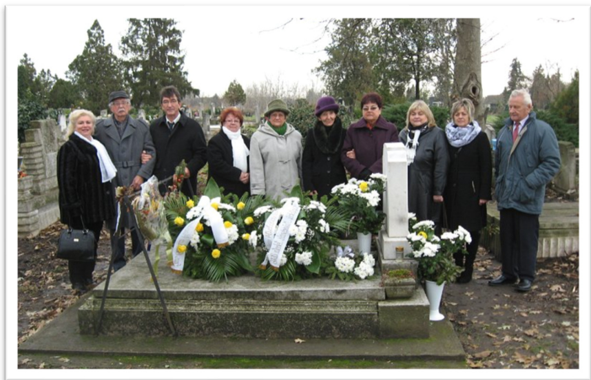
Sári Gusztáv sírjánál. Kaba, 2014.