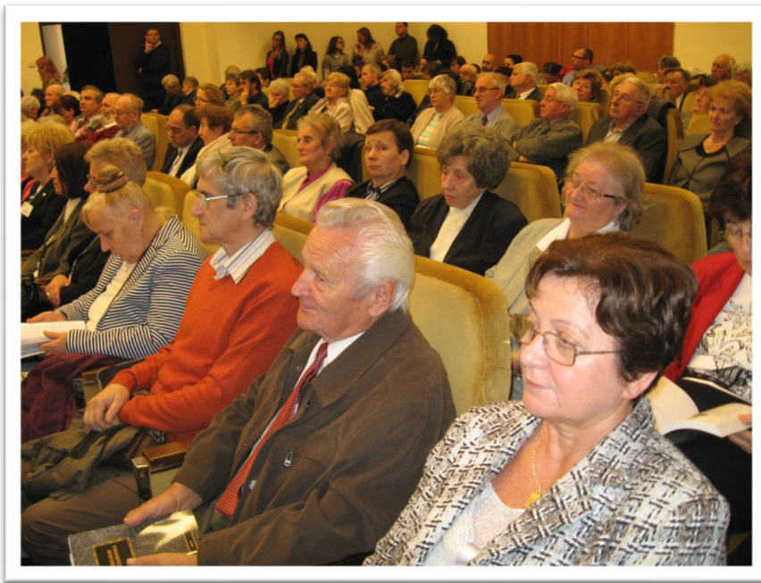
DAB székház 2018.